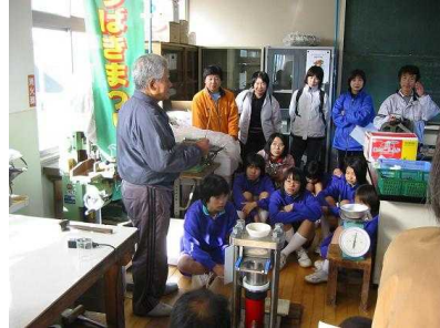
椿油搾りに合わせて陸地部からも研修に

古くから藪椿が群生しており、椿油を収穫していたが、近年途切れ、中学校の総合学習のテーマとして復活、平成15年より「椿油搾取機」を導入し、零細ながら椿油搾りを復活させ、現在では島を挙げての椿を活かした島づくりを行っています。