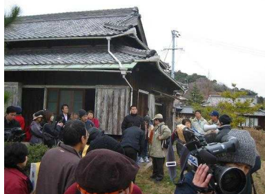
平成 16 年に開催した「空家めぐりツアー」

平成 14 年に高島支社の事業としてスタート。平成 15 年に 4 物件を基に 1 ターン者を募集。マスコミの助けもあり 3 ヶ月で空家が埋まりました。その後、「団塊の世代の田舎暮らし志向」もあいまって北木島・真鍋島・白石島に事業が広がり、平成 19 年 10 月現在 21 世帯 46 人の 1 ターン者を島に受けいれています。高齢化の著しい島の空家対策は地域を維持する人材の確保のみならず、仕事を作った若年世帯の移住もあり、小中学校の子供の確保にも大きく貢献しています。