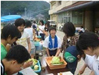
神戸の中学校の夏季キャンプを島に誘致

北木島では平成13年に廃校になった旧北木小学校の空き校舎を利用して、平成17年から中学校の夏季研修の受け入れを開始、平成19年には3団体の研修受け入れを行いました。白石島では平成13年から旧小学校の講堂を利用して、古くから行われていた機織りを復活させると共に、旧運動場の遊休地を利用して綿の栽培や島の草木で染めも行うなど一貫した機織り工房として再生し、現在は体験メニューとして白石島の観光プランに組み込まれるようになりました。