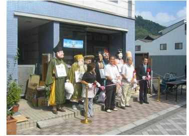
9月5日に駅前商店街に笠岡諸島アンテナショップ「ゆめポート」をオープン。陸と島との接点としての機能を果たす

ン。なかなか手に入らなかった「しまべん」も定期販売や島の特産品が陸地部で気軽に買えるとあって評判は上々。販売ルートの確立により、地域の特産物の掘り起こしや島にあった作物の新しい栽培等に大きな期待がかかっています。