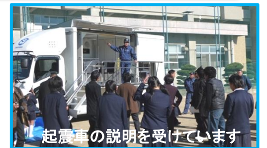
起震車の説明を受けています

12月17日(土)北木中学校体育館にて青少協主催【作文発表と地震防災教室】が開催されました。