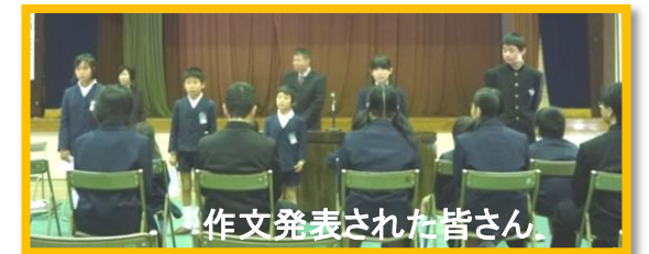
作文発表された皆さん